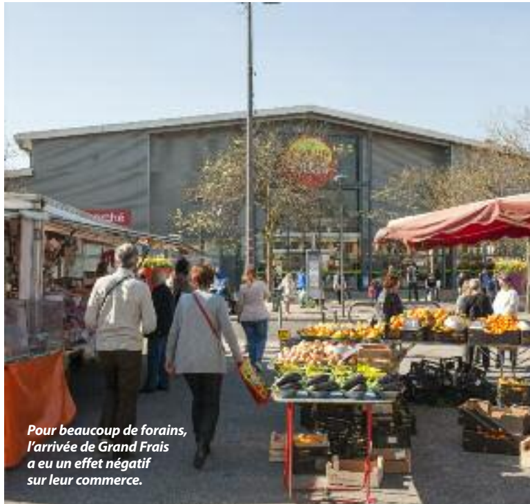
Pour beaucoup de forains, l'arrivée de Grand Frais a eu un effet négatif sur leur commerce.

"C'EST SÛR qu'il a un peu perdu de son charme par rapport au marché d'antan", se désolent les habitués présents place Gilbert-Boissier ce mardi matin. Le soleil de printemps est au rendez-vous, mais les clients eux, se font attendre : Le marché du Village n'est pas vide, mais il ne fait pas le plein pour autant. Idem pour les stands. Si le marché du Mas du Taureau regroupe une petite centaine de forains, celui du Village, le plus vieux de Vaulx-en-Velin, peine à en réunir une dizaine en semaine. "Si je reste, c'est que je ne peux pas me résoudre à laisser tomber mes clients", assure l'une des marchandes des quatre-saisons. "C'est un marché qui dépérit", constate Stéphane Bertin, adjoint délégué au quartier qui plaide pour davantage d'animations afin de booster le commerce. Il y a à la fois un problème de mode de consommation et une population qui change et vieillit. Il y a aussi l'implantation de Grand Frais qui a eu un effet concurrentiel".