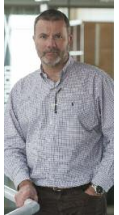
Bruno Lebuhotel, un cinq étoiles des sociétés coopératives